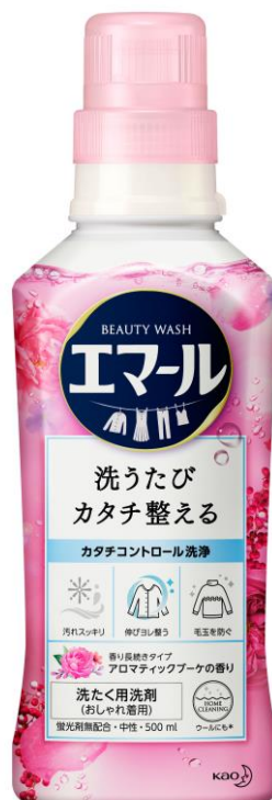
「アロマティックブーケの香り」