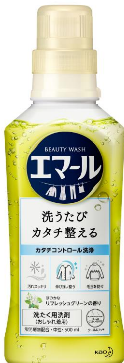
「リフレッシュグリーンの香り」

花王株式会社(社長・澤田道隆)は、2018年10月27日、おしゃれ着用洗剤『エマール』を改良新発売いたします。「カタチコントロール洗浄」により、衣類の糸1本1本をコートしてハリを出し、すべりを良くすることで、洗うたびに伸び・ヨレを整え、袖・首回りまできれいに洗えます。