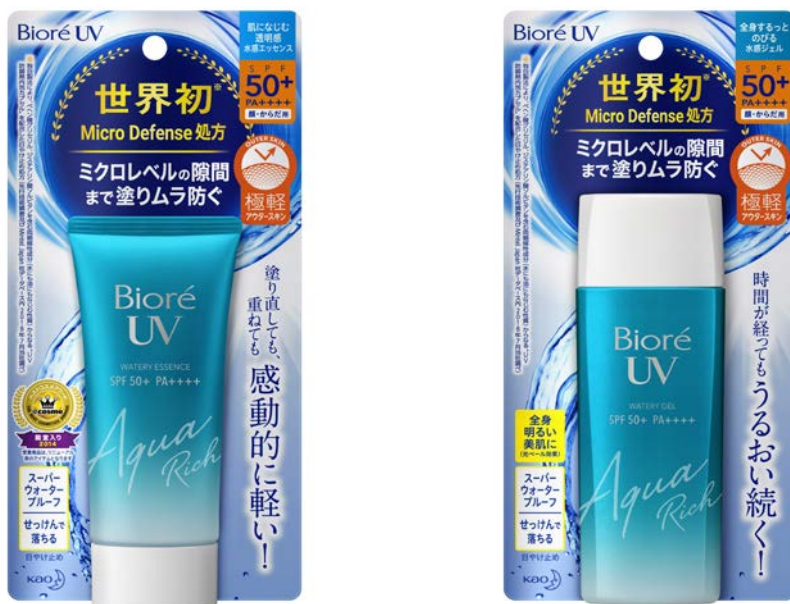
『ビオレUV アクアリッチ ウォーターエッセンス』 『ビオレUV アクアリッチ ウォータージェル』

※2 インテージSRI 日やけ止め市場 2006年9月~2018年8月 ブランド別売上数量