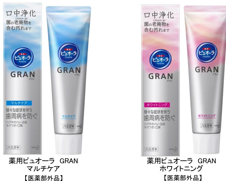
薬用ピュオーラ GRAN マルチケア 【医薬部外品】