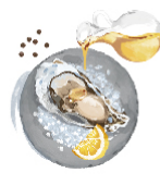
総料理長 オススメ レモンオイル ¥0 カルパッチョのような 味わいを楽しめる。