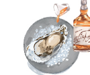
管理部 オススメ ウイスキー ¥650(税込¥715) イギリスやスコットランドで お馴染みの組み合わせ。 海の香りを引き立てる。