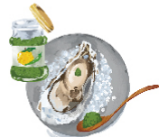
バイヤー オススメ 柚子コショウ ¥30(税込¥33) 辛味と塩気がマッチする。 日本酒に合わせて。