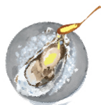
定番1 レモン汁 ¥0 レモン果汁です。 生しぼり風の香りと 酸味をお楽しみ下さい。

ゼネラル・オイスターグループのスタッフがおすすめする生牡蠣の食べ方をご提案します。その数 10 種類。定番の牡蠣にレモンや、「レモンオイル」、「ごま油+塩」、「柚子胡椒」、「レモンシャーベット」など、これまでであったことのない食べ方が勢揃い。いずれも日々牡蠣と向き合うプロフェッショナルたちがおすすめする食べ方なので、お気に入りの味わいがきっと見つかるはずです。※2：一部食べ方は有料となります