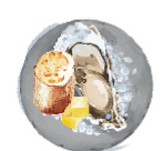
営業本部長 オススメ バターバケット 2P ¥350(税込¥385) フランスでは一般的な 付け合わせ。