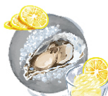
広報 オススメ レモンシャーベット ¥200(税込¥220) 牡蠣を食べた後のお口直し にどうぞ。お寿司でいう ガリのような役割。