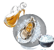
総料理長 オススメ ごま油+塩 ¥0 ごま油の風味は 牡蠣との相性抜群。