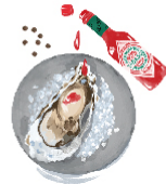
代表取締役 オススメ タバスコ+黒コショウ ¥0 辛味と酸味のバランスが絶妙。