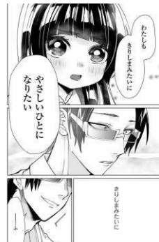
「組長娘と世話係」©つきや ©マイクロマガジン社