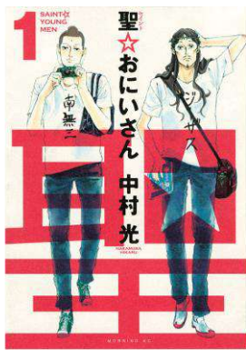
『聖☆おにいさん』 ©中村光/講談社