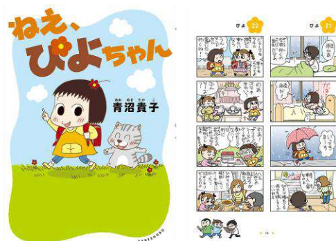
「ねえ、ぴよちゃん」 ©青沼貴子/竹書房

「天真爛漫のぴよちゃんと猫達が可愛くて、見ていてほっこりします」 「とにかく猫たちが可愛い。お兄ちゃんもお寺の住職さんも、みんな生き生きして、この町で生活したいです」 「特別な出来事はないけど、平凡な日常が一番幸せだと思わせてくれる」