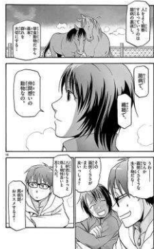
「銀の匙 Silver Spoon」©荒川弘 / 小学館