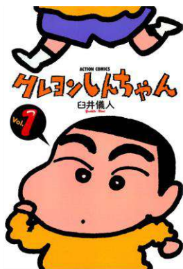
「クレヨンしんちゃん」 ©臼井儀人/双葉社