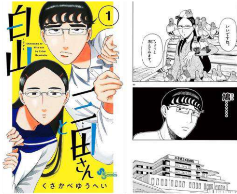
「白山と三田さん」 ©くさかべゆうへい / 小学館

「自分の高校時代に、こんな風にマイペースで、周りに流されず好きな事をしたかったなと思う」 「純粋な恋愛がキュンキュンした」 「見た目は地味なのに、個性が強いキャラばっかでこんな人たちが周りにいたら楽しそう」