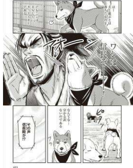
「織田シナモン信長」©目黒川うな/コアミックス

「犬になってほのぼのとした日常を送りたい」 「前世の因縁があるようでないような、そして犬の本能が抑えきれない平和な世界が好きです」 「ワンちゃん達の世界が微笑ましくて楽しい気持ちになる」