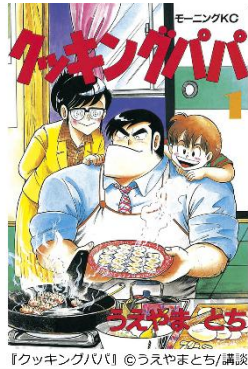
『クッキングパパ』 ©うさやまとち/講談社

「クッキングパパは長編で連休中に読みながら 実際に出てきたレシピで料理してみたい」 「連休になったらゆっくり読んで、作り置きおか ずに挑戦してみたいです」 「料理のレパートリーを増やしたいから」