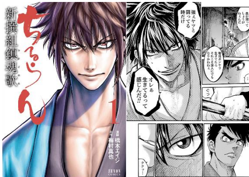
「ちるらん 新撰組鎮魂歌」 ©橋本エイジ・梅村真也/コアミックス

「新撰組が好きだからです！」 「もともと新撰組に関心があり、関連する多数の文 献・小説・漫画を読み、映像化作品も観てきた。今 回また新たな解釈で映像化されたとのことで、その 原作の漫画を読みたいと思ったから」 「史実や時代考証が違うようですが、新撰組が好き なので、別の角度から読んでみたい」