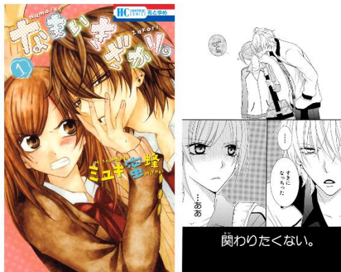
「なまいきざかり。」 ©ミユキ蜜蜂/白泉社

「ミユキ蜜蜂先生がとにかく好き、そして一番好 きな作品。定期的に読み返したくなる」 「成瀬がかっこいい！」 「キュンキュンするシーンが目白押しで、定期的に読み 返したくなる作品です」