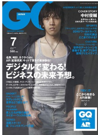
左: iPhone × AR 店舗誘導マーケティングツール 右: GQ JAPAN 7月号 表紙