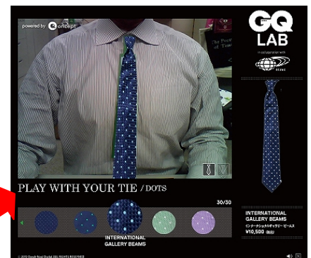
左: ネクタイが試着できる AR マーカー (赤枠内) 中: GQ.com 内 AR 説明画面 右: GQ.com 内 AR 体験画面