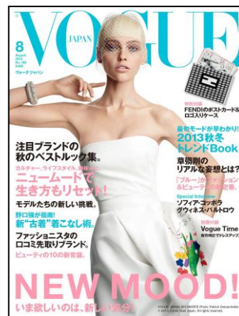
VOGUE JAPAN 2013年8月号