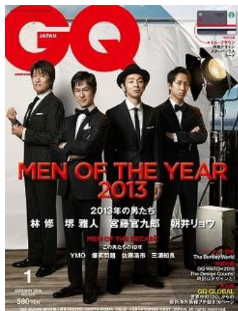
GQ JAPAN 2014 年 1 月号

トム ブラウン ニューヨークを象徴するカラーコンビネーションである、ネイビー、ホワイト、レッドのトリコロールカラーをあしらったカードは、全国のスターバックスやオンラインで現金をチャージして利用いただけます。なお、特別付録のカードの残額は 0 円です。店舗や WEB で入金してご利用ください。