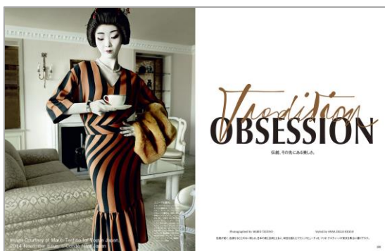
VOGUE JAPAN 2014年11月号