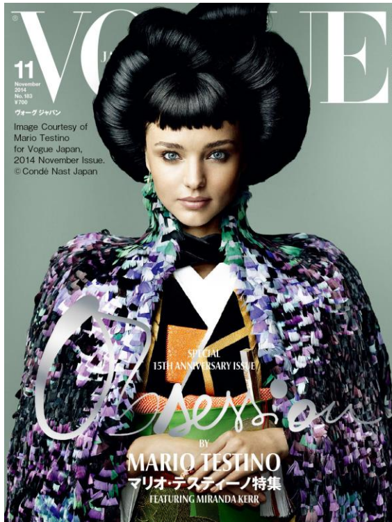
VOGUE JAPAN 2014年11月号

世界で最も影響力のあるファッション誌『VOGUE』の日本版『VOGUE JAPAN』11月号(9月27日発売)は、創刊15周年アニバーサリー企画第三弾として、世界で最も影響力のあるフォトグラファーの一人、マリオ・テストティーノとのコラボレーションによるスペシャルバーションをお届けします。