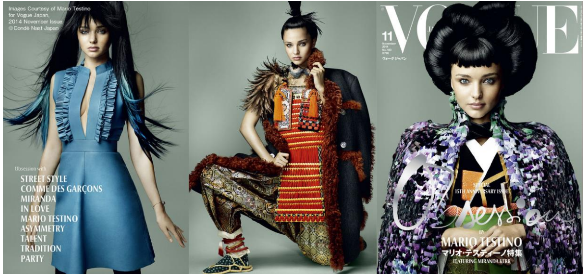
VOGUE JAPAN 2014年11月号