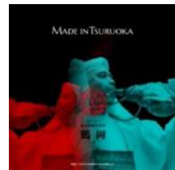
Made in Tsuruoka

※その他出展ブース詳細はこちらより→ https://new-energy.ooo/03/brandlist/