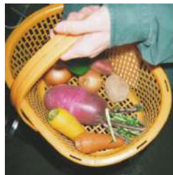
ORGANIC & CO