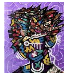
NOVOL:バイーター/デザイナー