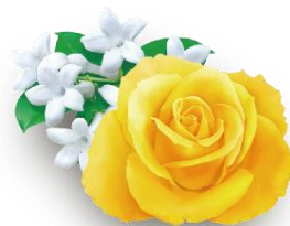
一番人気の ローズとジャスミンの香り