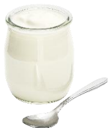
肌のコラーゲン生成を促進する ヨーグルト成分※3

現在、身体の乾燥に悩んでいる人が7割近くに上る一方で、実際に保湿剤を使用した人は5割にとどまり※1、その理由は「面倒くささ」や「ベタつきへの抵抗」であることがわかっています※2。このようなニーズを捉え、「ジョンソン®ボディケア エクストラケア 高保湿クリーム」は、ヨーグルト成分※3を配合することで、当社の保湿剤と比べて約3倍以上の保水力を発揮し、保湿力を保ちながらベタつきのレベルを半分以下に抑えた※4快適な使用感の高保湿クリームに仕上げました。また、「ジョンソン®ボディケア エクストラケア 高保湿ローション」でもっとも親しまれている香りである、ローズとジャスミンの香りを採用し、ボディのお手入れにリラックスのひとつときをもたらします。