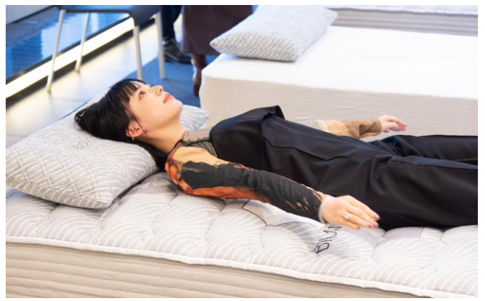
自分にオススのPAD位置を確認