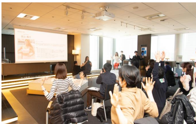
骨格タイプ別のオスス筋トレ方法を体験