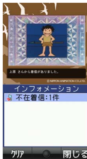
＜不在着信通知画面＞