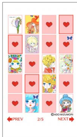
<ライブラリー画面>