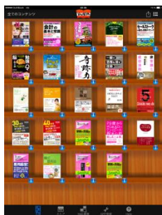
YOMiPO アプリでビジネス書が読み放題！