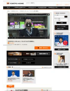
会員様専用サイトでは著者の生放送番組も！