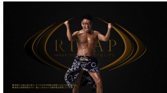
【RIZAP 公式 HP にて動画公開】・『BA 生島ヒロシ』篇: http://www.rizap.jp/cm/