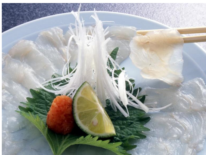
噛めば噛むほど旨味が溢れる熟成とらふぐの「てっさ」