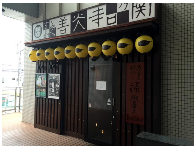
玄品ふぐ 善光寺口乃関 入口イメージ

関東・関西を拠点に全国 90 店舗を展開する とらふぐ料理専門店「玄品ふぐ」、「玄品 以蟹茂」、「ふぐ・かに専門 玄品」（株式会社関門海、本社：大阪市西区、代表取締役社長：田中 正、以下玄品ふぐ）は、長野県では初となる【玄品ふぐ 善光寺口乃関】を、2016年9月10日（土）にオープン致します。