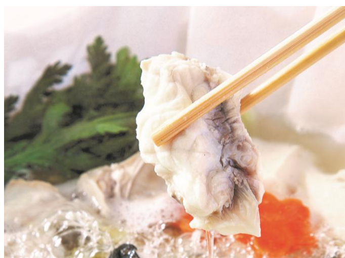
とらふぐ料理の定番「てっちり」