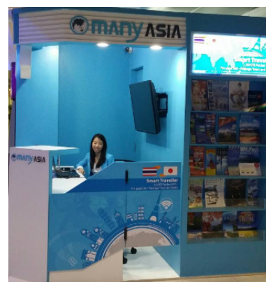
■スワンナプーム国際空港内ブース