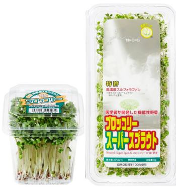
左: ブロッコリースプラウト 右: ブロッコリー スーパースプラウト

株式会社村上農園(本社:広島市、代表取締役社長:村上清貴)が生産販売する2つの機能性野菜「ブロッコリースプラウト」および「ブロッコリー スーパースプラウト」の今年1~5月までの累計出荷量が、前年同期比150%と好調に推移しています。この背景には「機能性野菜」への注目度の高まりがあります。