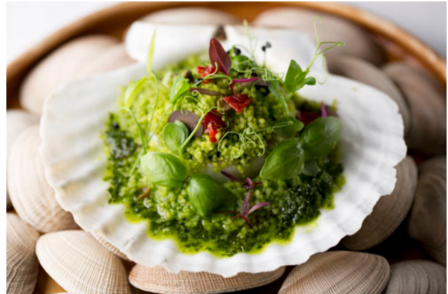
《ホタテ貝のパセリバター》 アマランサス、クレイジーピー、パクチー、 バジル、ロックチャイブ使用