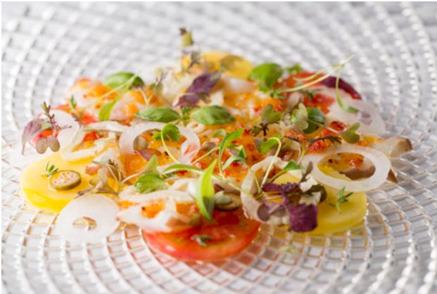
《水タコと季節野菜のサラダ》 紫蘇グリーン、紫蘇パープル、パクチー、 レッドマスタード、バジル使用