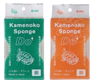
亀の子スポンジDo パス洗い 【カラー】グリーン・オレンジ 【価格】各450円（税抜）