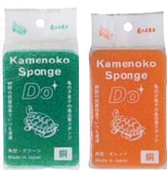
亀の子スポンジDo 角型 【カラー】グリーン・オレンジ 【価格】各230円（税抜）