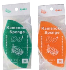
亀の子スポンジDo 木の葉型 【カラー】グリーン・オレンジ 【価格】各230円（税抜）