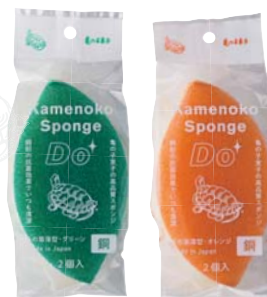
亀の子スポンジDo 木の葉薄型（2個入） 【カラー】グリーン・オレンジ 【価格】各340円（税抜）