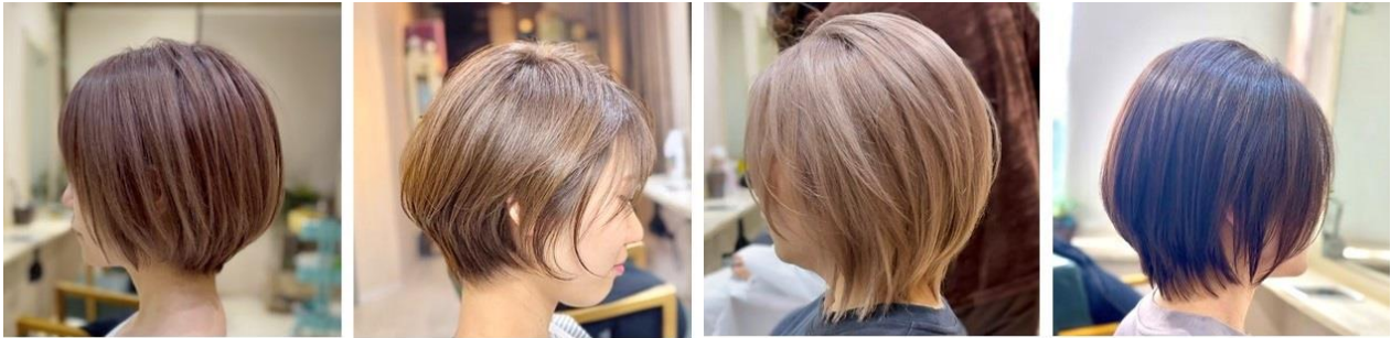
エラハリさん & 面長さんがマスクなしでも似合うショート（左2つ）・ボブ（右2つ）ヘアスタイル

以上4つのことが重要です。中でも、1番顔の形を補正しやすく、シルエットも変えやすいショートボブが、オススメです。