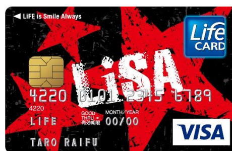
LiSA CARD ROCK ライフ