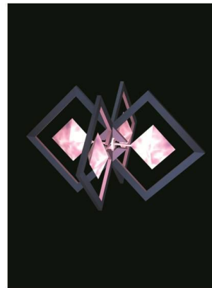
《購入特典アイテム2種》