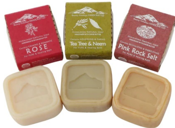
『Fayurworld(アーユルワールド)』