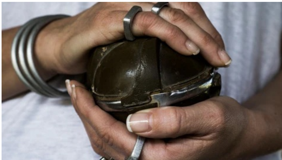
『NO WAR FACTORY (ノーワーファクトリー)』

ラオスに残る地雷や不発弾などの戦争廃材をアップサイクルし、ラオスとイタリアの職人が平和への想いを込めてハンドメイドで制作するジュエリーブランド『NO WAR FACTORY』。ジュエリーは、地雷や爆弾、戦闘機の破損片といった戦争の名残の生まれ変わり。ラオスに残り続けるベトナム戦争時代の武器の残骸＝戦争廃材をアップサイクルし負の遺産を減らすこと、そして世界から武器と戦争をなくすno warのメッセージを発信することを目指しています。