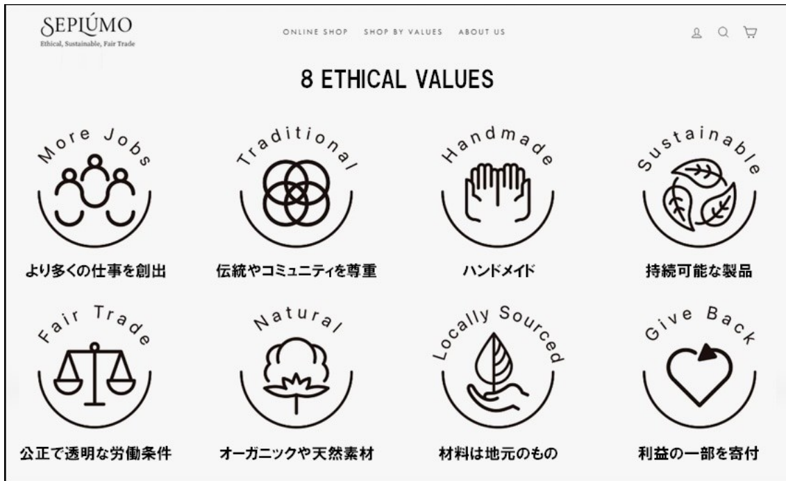
[8つのエシカル基準]

SEPLÚMOは、自社にとってのエシカルを定義するために、8つの独自基準を作りました。