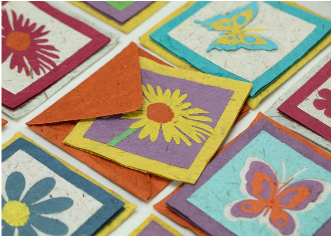
『POOPOOPAPER (プープーペーパー)』