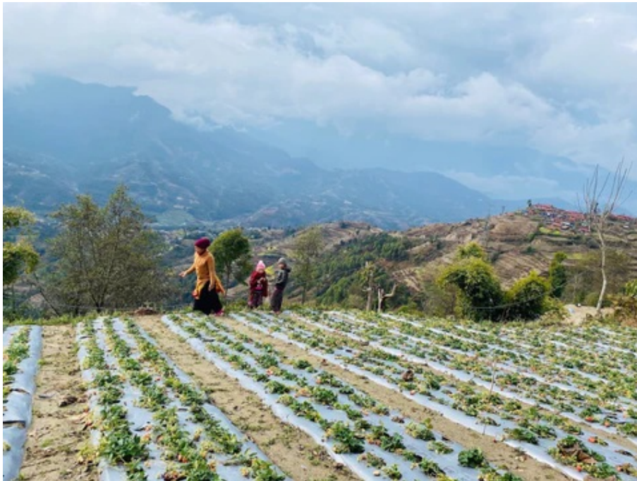
[ネパールカカニ村でのいちご栽培]