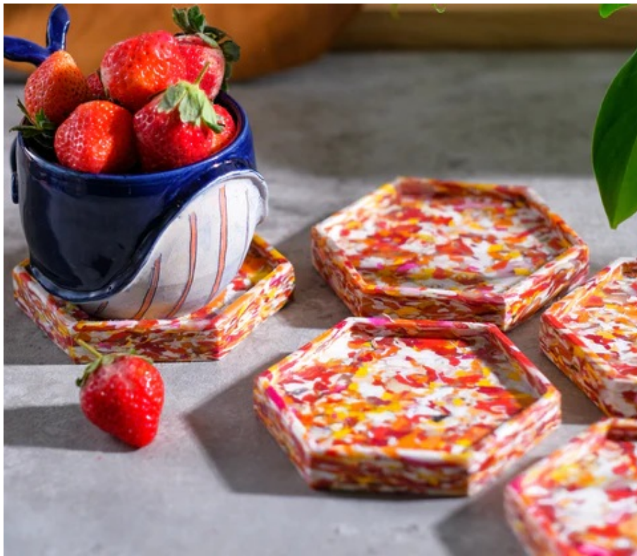
『Sukhasa Studio(スクハサスタジオ)』