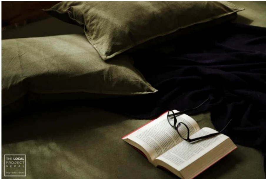
『THE LOCAL PROJECT NEPAL (ザローカルプロジェクトネパール)』

ローカルプロジェクトネパールは100%地元ネパールで作られたさまざまなアイテムを取り扱うプラットフォームです。生産のすべての過程で安全で公正な労働条件を確保し、女性と社会的に疎外された人々に力を与え、再利用とアップサイクリングの概念をサポートし、天然素材を使用し、ネパールの伝統的な職人技を維持しています。ネパール草木染め天然素材の高品質ベッドシートや、障害のため話せない熟練した職人たちが丹念に手作りしたピアスなどを取り扱っています。