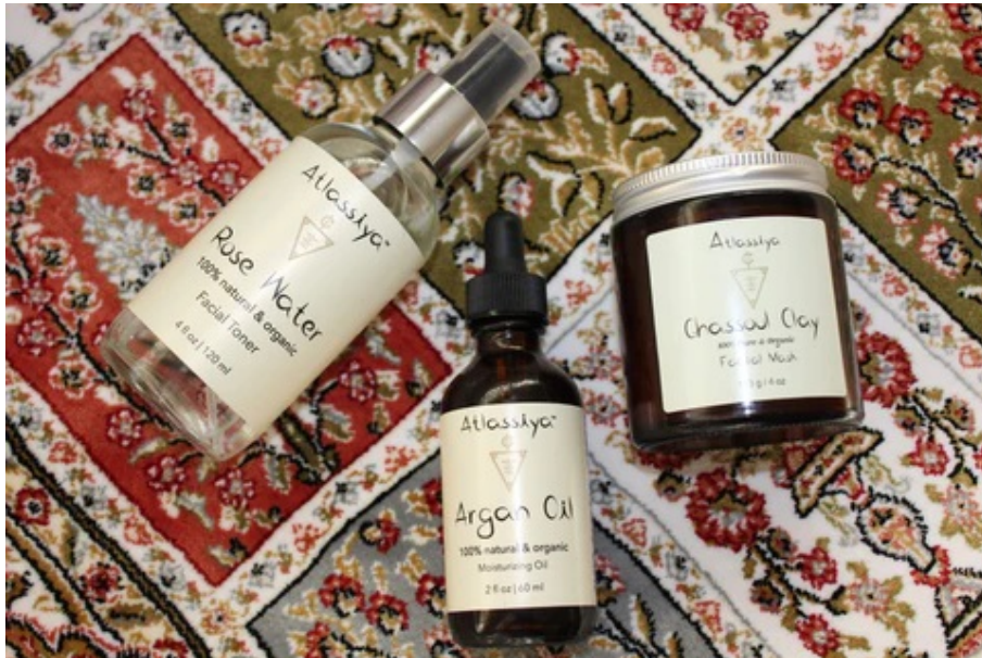
『La Coupe(ラ クーペ)』

旅と雑貨が好きなバイヤー自らが世界各地で直接手に取り、買い付けをしてきたインテリア雑貨たち。モロッコをはじめとしたアフリカ各地、そしてインドブロックプリントファブリック、日本の手仕事雑貨など、日々を豊かにするアイテムをセレクトし、皆様の暮らしへお届けします。モロッコの大地で育った貴重な原産を使った防腐剤フリーのアルガンオイルやローズウォーターなどを扱っています。アルガンオイルの製造プロセスでは、現地モロッコの女性たちが活躍し、収入源へと繋がっています。