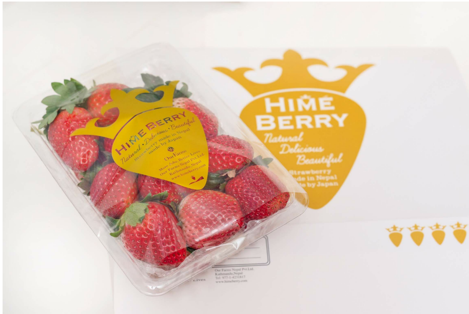
ネパールでのいちごブランド『HIMEBERRY』