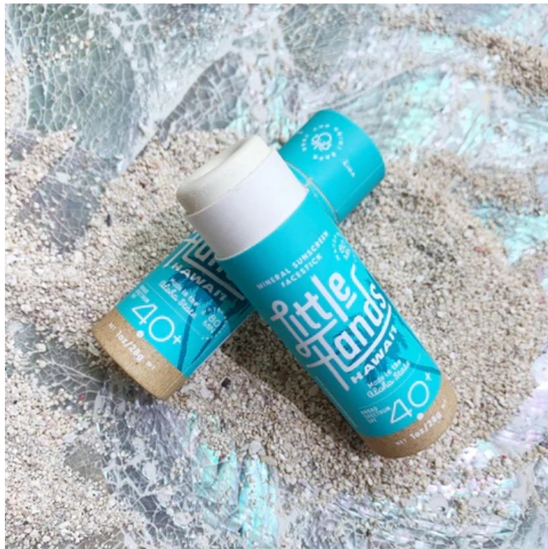
『Little Hands Hawaii(リトルハンズハワイ)』

海に優しいハワイの日焼け止めLittle Hands Hawaii。サンゴ礁に害を与えるオキシベンゾンやオクチノキサートを含まない、赤ちゃんから使える海にも人にも優しい日焼け止めです。肌をキレイにするエルダーベリーや自然のSPFが含まれていると言われるココナッツオイルが、ベタつかずしっとりとした肌をキープしてくれます。