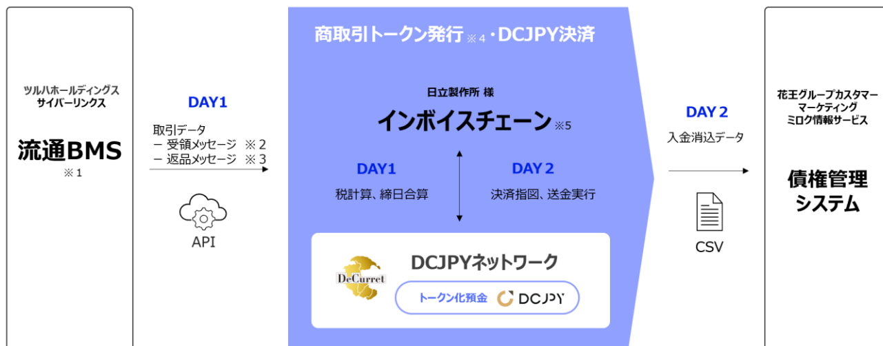
【図：実証実験のスキーム図】