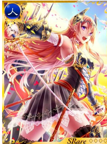
CM 放映記念キャンペーンでもらえる 限定「Sレアカード」 - 『薔薇姫マーガレット』

今回、新 CM 放映を記念して実施されるキャンペーンでは、放映期間中に『神獄のヴァルハラゲート』にログインした方全員に、ログインボーナスとしてレアリティの高い限定「Sレアカード」を最大 5 枚プレゼントします。また、5 回目のログインでは、新機能として追加された「アクセサリ」もプレゼントします。 ※本キャンペーンは CM 放映開始日の、3 月 20 日 17:30 より開始予定です。