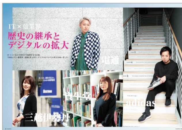
IT × 他業界

連載企画の「10社10色」では、「理想の花金の過ごし方」というテーマで、10社の方々にお答えいただきました。その他、毎号連載の「仕事のすゝめ」、「ホンマでっか!? こだわり施策」、「NEXT GENERATION CREATORS」なども含めた、全9企画、23企業の方々取材させていただきました。