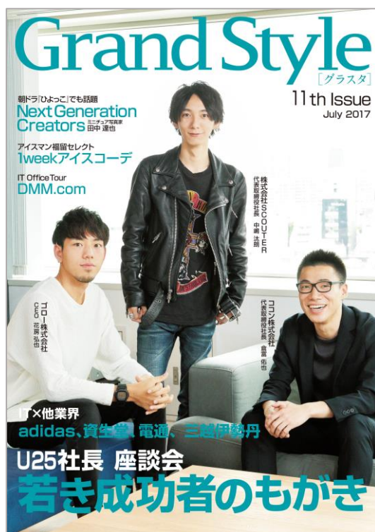
『Grand Style』11 th Issue 表紙