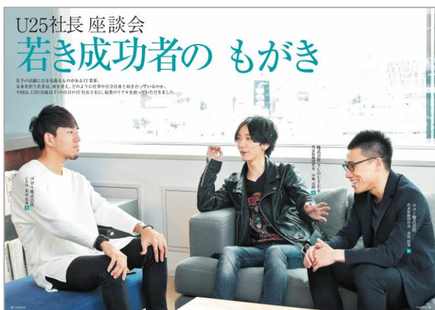
「U25 社長 座談会」