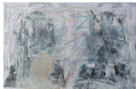
パスポート写真を用いた自画像