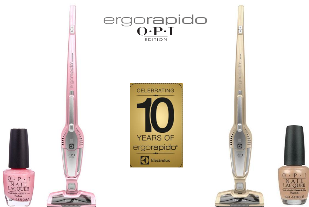
APOPI1 プリンセス ルールズ!

エレクトロラックスは、今後も皆さまがより快適にお掃除できる製品を提供してまいります。