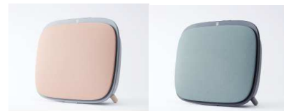
持ち運びやすいハンドルと背面のくぼみ

上部のレザー調のハンドル、背面のくぼみで、製品をしっかりとホールドして持ち運びをすることができます。両手で両サイドを持ちやすいようにリブ（畝）があります。また、壁にかけて使用することも可能です。