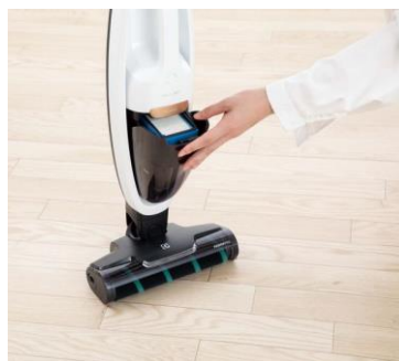
※画像は Well Q7 サテンホワイトです。