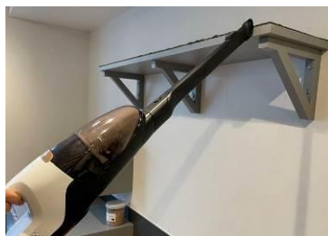
<高いところまで届く、スーパーロングノズル>