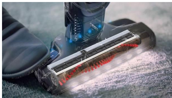
<ブラシロールクリーンフロアノズル>