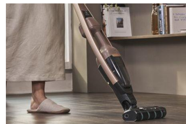
<パワープロフロアノズル>

柔らかいブラシと、細かなゴミが取れる硬いブラシの組み合わせのブラシロールで、フローリングの溝にたまった繊維やほこりも逃しません。毛が絡みづらく、お手入れも簡単なクリーナーヘッドです。