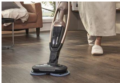
<パワープロモップノズル>

上記 5 点のほか、スーパーロングノズル用アングルブラシ、ブラシノズル、すき間ノズル、ソフトブラシノズル、フレックスホースの計 10 点が付属します。