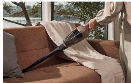
<スーパーロングノズル>