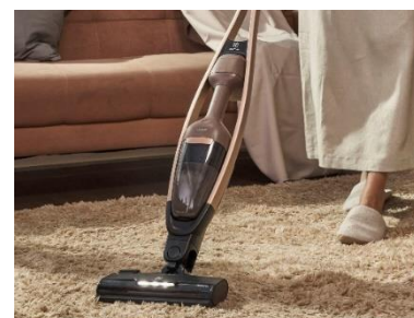
<ブラシロールクリーンフロアノズル>

硬い素材を使用したブラシが回転しながらカーペット上のゴミをかき取ります。エレクトロラックスの特許技術『ブラシロールクリーン機能』が搭載されており、髪の毛やペットの毛が絡まってもスイッチを押すだけで簡単に除去することができます。