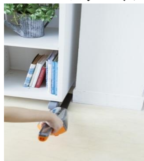
ロング隙間ノズル