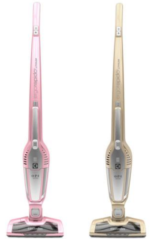
エルゴラピード・リチウム O・P・I限定モデル

APOPI1 APOPI2 プリンセス アップ フロント & ルールズ! パーソナル