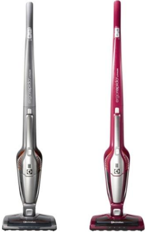
エルゴラピード・リチウム