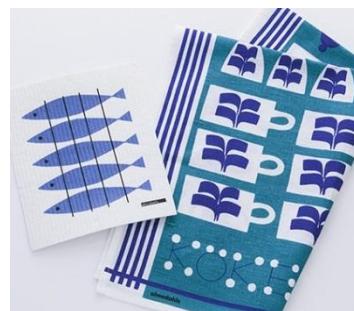
スウェーデン almedahls キッチンタオル & スポンジワイプセット