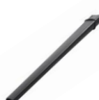
ロング隙間ノズル