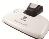
ベッド・プロ・パワー™ UV ノズル