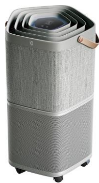
Pure A9 (PA91-406GY)

機能・性能はもちろんのこと、暮らしがより豊かになるようなデザイン性の高いものを求める消費者ニーズにも合うこれまでにないような新しいデザインを追求し、ペンタゴンデザイン(五角形)やファブリック素材、レザー調のハンドルを採用しています。その為、インテリアに調和し、自由にお部屋にレイアウトできます。