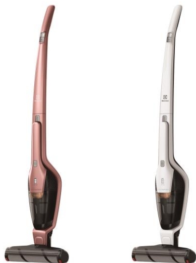
エルゴラピード・パワープロ (ZB3414AK)

また、せっかく吸い取った花粉を、排気として部屋に巻き散らさないよう、注意が必要です。エルゴラピードは、排気がきれいなことも特徴です。排気フィルターは表面積が広いので、PM2.5より小さい微粒子を99.99%しっかり捕らえ、目詰まりしにくく、排気性能に優れています。そのため、ハウスダスト、花粉、カビ粒子など、気になる物質をお部屋にもらしません。