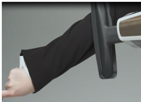
※ハンディに布ノズルをつけて掃除するイメージ画像

また、床に溜まった花粉は、空気清浄機だけではなかなか完全に取り切ることは出来ません。