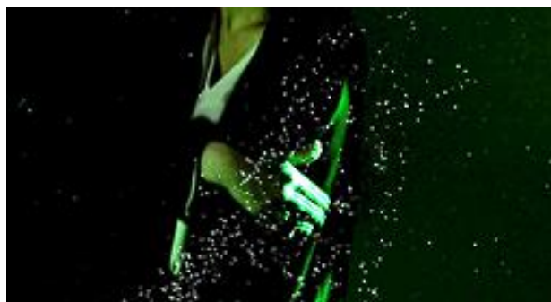
手で払うと花粉を飛散させてしまう