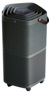
Pure A9 (PA91-406DG)