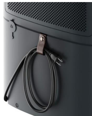
電源コードのタグは、ダークグレーには レザー調素材 を、セラミックホワイトには ファブリック素材 を採用

iF DESIGN AWARD 2022 ULTIMATEHOME series (dehumidifier/air purifier combo) 受賞ページ（英語）： https://ifdesign.com/en/winner-ranking/project/electrolux-ultimatehome-series/345418