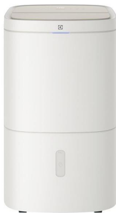
ダークグレー（EDH12TRBD3）／セラミックホワイト（EDH12TRBW3）