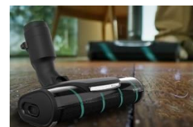
<パワープロフロアノズル>