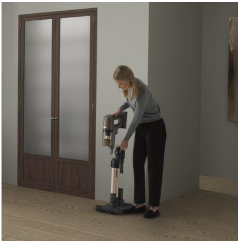
＜クイックリリース＞

ハンディクリーナーとして使用する際も、充電ステーションのボタンを押しながらハンドユニット部分を持ち上げるだけで取り外し可能。