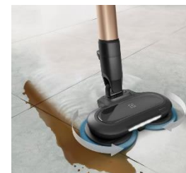
<パワープロモップノズル>