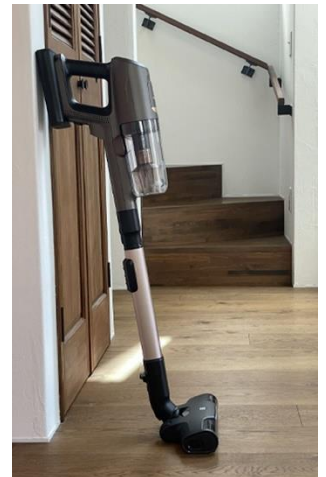
＜壁に立てかけることも＞