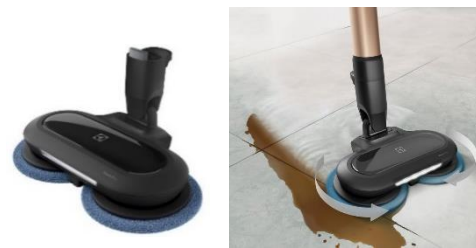
<パワープロモップノズル>