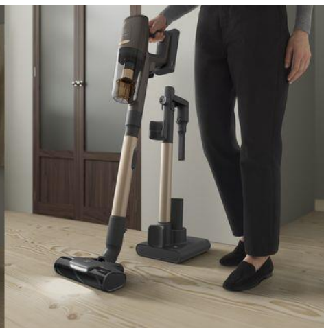
<ロールインロールアウト>