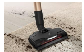
<ブラシロールクリーンフロアノズル>

◆ ブラシロールクリーンフロアノズル 硬い素材を使用したブラシが回転しながらカーペット上のゴミを強力にかき取ります。 エレクトロラックスの特許技術「ブラシロールクリーン機能」 が搭載されており、 髪の毛やペットの毛が絡まってもスイッチを押すだけで簡単に除去することができます。