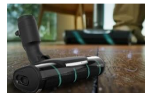
<パワープロフロアノズル>

◆ パワープロフロアノズル フローリングの溝にたまった繊維やほこりも逃しません。毛が絡みづらく、お手入れも簡単なクリーナーヘッドです。