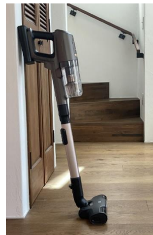
<壁に立てかけることも>