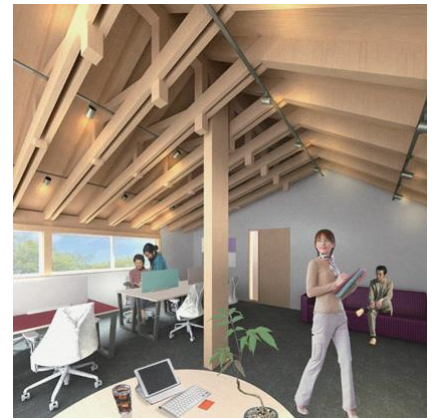
シェアオフィススペース (イメージ)