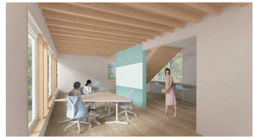
コワーキングスペース (イメージ)