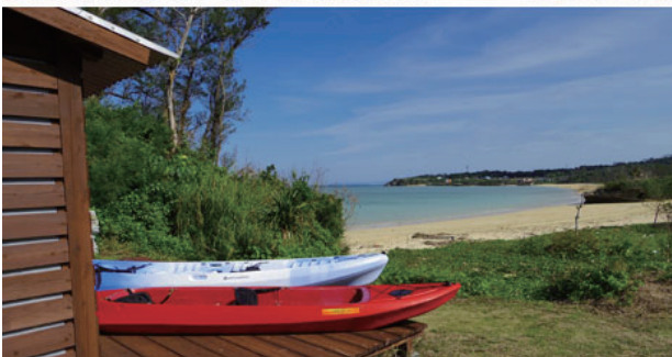
写真上段：外観、写真下段：隠れ家ビーチ&カヤック

贅沢な隠れ家ビーチに建つ、コテージタイプの別荘です。近くには大人気の美ら海水族館、沖縄らしい街並のフクギ並木、美しいビーチのある島々もたくさん。ビーチが目の前のガーデンには、ピザ釜やバーベキュー設備もあり、家族や仲間とのビーチパーティーにもぴったり。オプションで施設の目の前から出発するカヤックツアーもご用意！早起きしてカヤックで朝ご飯の旅！