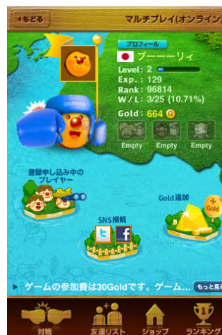
自分のレベルは今いくつ？ 世界ランキングもチェックしよう