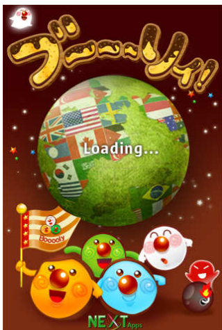
世界 200 万ダウンロードを記録した 大人気タッチパネルパズル