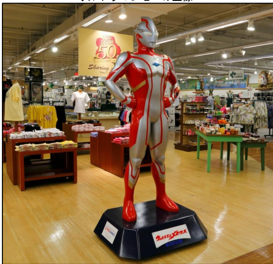
ヒロハッティ・ニミツに設置された ウルトラマンメビウスの立像