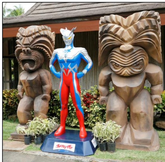
ポリネシア・カルチャー・センターに設置された ウルトラマンゼロの立像