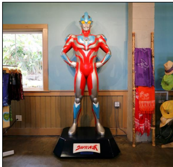
クアロアランチに設置されたウルトラマンギンガの立像