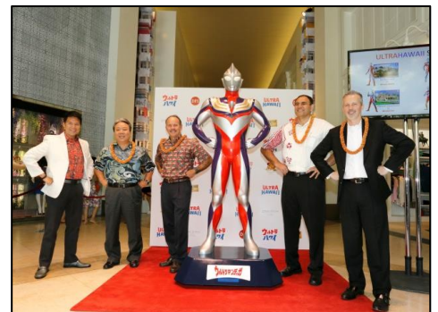
Tギャラリー by DFS で開催された除幕式

またウルトラマンガingaは立像としては初登場、そして全4体とも国外初お披露目ということで話題を呼んでいます。 各ウルトラマンの設置場所は、以下のとおりです。