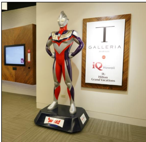
T ギャラリー by DFS に設置されたウルトラマンティガの立像