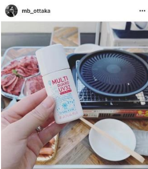
いいね! : 1981wakutaku, 他 mb_ottaka... 続きを読む 2020年9月16日

ゲーム感覚で取り組めるよう、チーム対抗戦にするなど工夫をしています。1～2か月ごとにチームを組み替えるので、部署内外の交流が生まれます。また、インスタグラム上でお互いの趣味・好きなことを知るきっかけともなり、社内外のコミュニケーションを活発化させる効果を生んでいます。