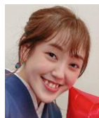
参加した新入社員

チーム対抗で数当てゲームをしました。副社長が1分で何個箱を積めるか！とか。皆さん全力で楽しんで、笑いの絶えない時間でした。司会を務めていた部長陣の、豆絞りスタイル（現在放映中CMのコスプレ）も似合いませんが、会社とは思えないとても楽しいイベントでした。