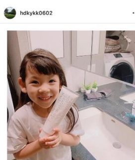
いいね! : scy.sakai, 他 hdkykk0602... 先週、3歳の頃から習っている... 続きを読む