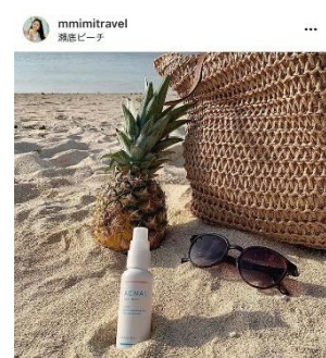
いいね! : beaute_sommeliere_academy, 他 mmimitravel... 続きを読む 6日前