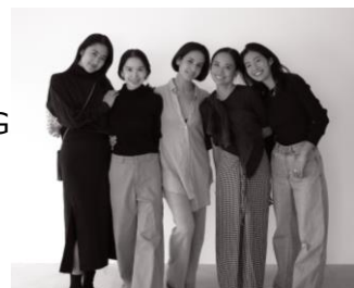
プロデュース・クリエイティブチーム

モニターの皆様からは、「CALM BALANCINGを飲んでいて、安心感があった。」 「いつもより穏やかな日々を送れている実感を持つことができました。」とコメントいただいています。