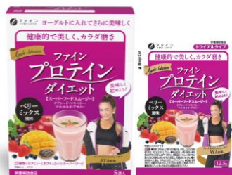
・分包タイプ(5袋) 外箱・内袋