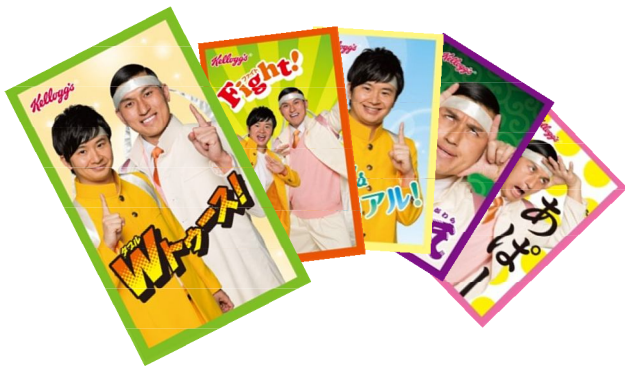
<オードリー オリジナルシール>