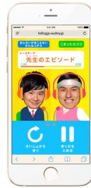
<「オードリーのグレートモーニングニッポン」サイト>