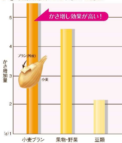
●1gの食物繊維摂取による平均のかさ増加量

©2017 Kellogg's. Nutritional Information & Health Claims Review. 2017-08-01. 2/10. 10/10/17