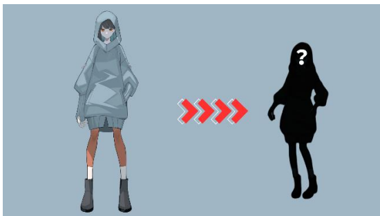
未完成ブレイブ/YU 未完成ブレイブ (Vo)