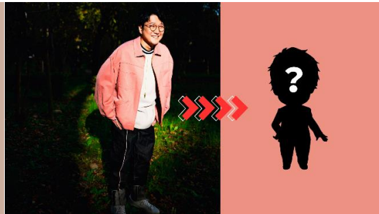
松室政哉 (まつむろせいや) シンガーソングライター