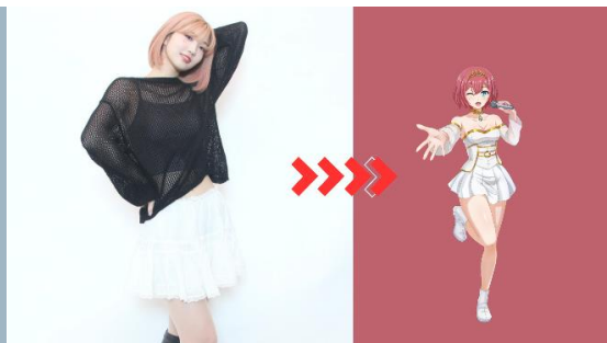
晴歌 (HARUKA) カラオン公式 VTuber